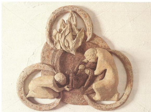
Foto: Keramik „Barmherzige Dreifaltigkeit“ ©Sr.M.Caritas Müller OP, Schweiz

Wie können wir Gott und unser Leben, Glaube und Welt zusammenbringen? Jede/r Teilnehmer/in erhält eine Mappe, in der für jeden Tag während der Fastenzeit ein Impuls vorgegeben ist, mit dem man sich ca. 30 Minuten beschäftigt. Am Abend ist ein 15-minütiger Tagesrückblick vorgesehen.